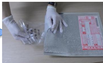
クール宅急便で発送