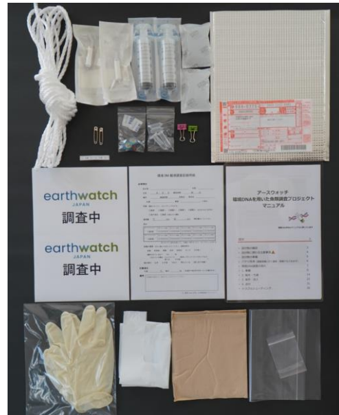
研究者から送付される調査キット

ボランティアが採取したサンプルに含まれる魚のDNAを解析することにより、その海域にどんな種類の魚が生息しているかを把握できます。それらは、日本の魚類の分布や多様性を調べるうえで、貴重なデータとなります。