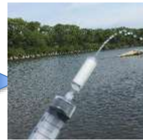
フィルターによるろ過