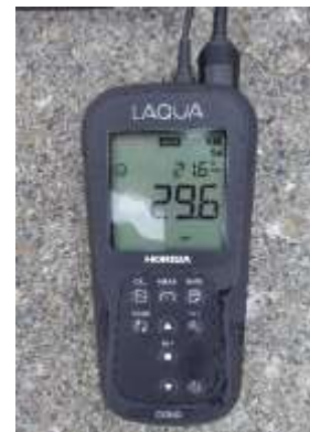
研究者から送付される水温塩分計※