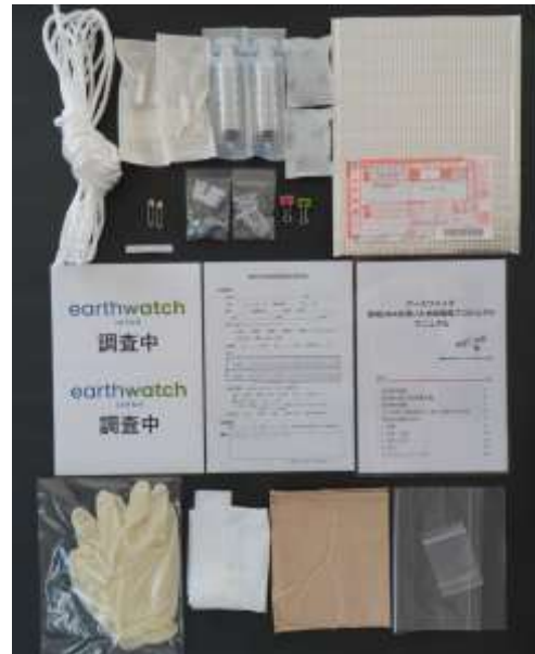
研究者から送付される調査キット※

※写真のキット及び水温塩分計は昨年のもので、本年は内容や機種が変更される可能性があります。