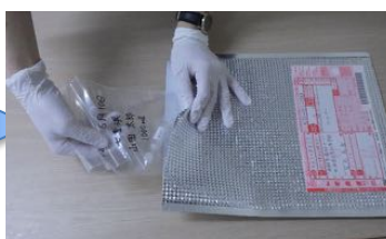
クール宅急便で発送