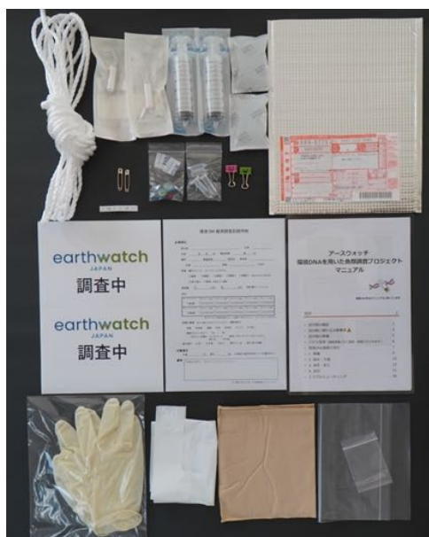
研究者から送付される調査キット

ボランティアが採取したサンプルに含まれる魚のDNAを解析することにより、その海域にどんな種類の魚が生息しているかを把握できます。それらは、日本の魚類の分布や多様性を調べるうえで、貴重なデータとなります。