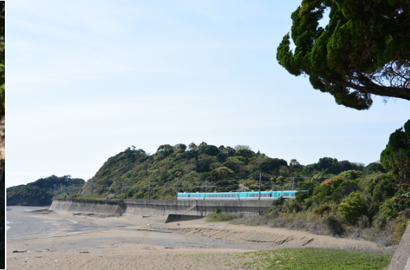
紀勢本線沿いの浜にウミガメが産卵に来る