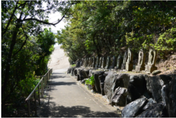
海から千里観音に至る参道