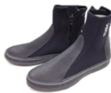
浜歩きには沢たび・ダイビングブーツをご用意ください