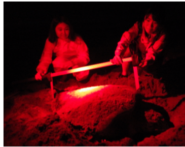
背甲の測定をしている所