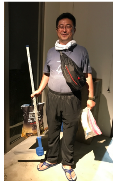
装備の一例。ビーチでは沢たびを着用