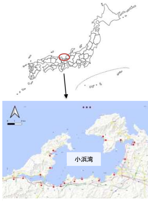
調査エリア（赤は産卵期の3月の調査予定地）

本研究では、シロウオ資源の回復を目指し、まず河川における親魚の遡上・産卵の実態を調査します。さらに、産卵後に孵化した仔魚が降海した後の生息場所を調べ、遡上量減少の原因を明らかにします。そして、かつての河川環境を取り戻すための方策を検討します。