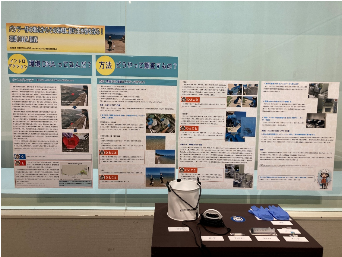
(図5) 調査で実際に使用した道具に触れる展示