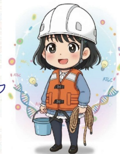
(図 4) 環境 DNA 調査の実施方法を紹介するパネル③

「海や川など調査地の水をろ過して環境 DNA をフィルター (ろ紙) に集める作業」で使う道具を展示しているよ。手に取ってさわってみてね! (やさしくさわってね)