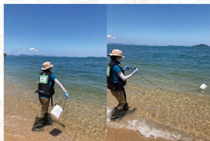
(図 2) 環境 DNA 調査の実施方法を紹介するパネル①