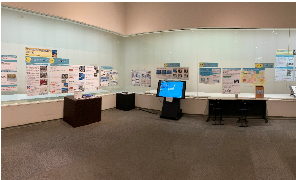
（図 1）環境 DNA を特集したゾーン